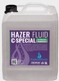
Bidons 2,5L – 5L – 10L – 20L 200L -1000L