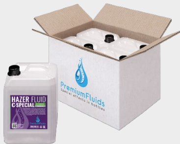
Cartons 6x2,5L – 4x5L