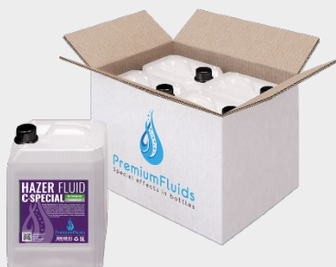
Cartons 6x2,5L – 4x5L