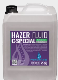
Bidons 2,5L – 5L – 10L – 20L 200L -1000L