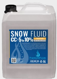
Bidons 2,5L – 5L – 10L – 20L 200L -1000L