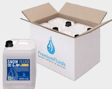
Cartons 6x2,5L – 4x5L